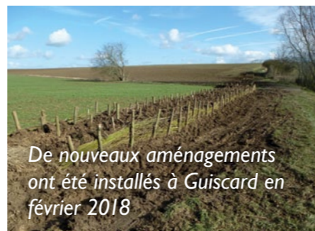
De nouveaux aménagements ont été installés à Guiscard en février 2018