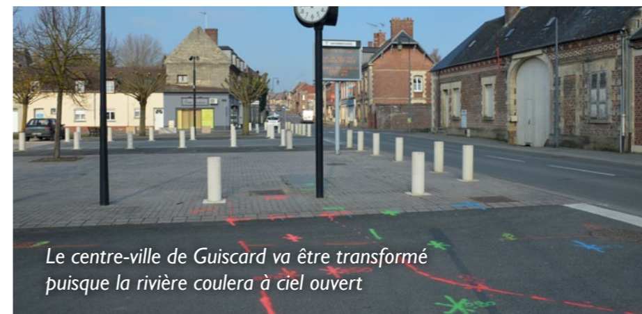
Le centre-ville de Guiscard va être transformé puisque la rivière coulera à ciel ouvert

Ces travaux seront de plusieurs types : réfection de ponts, réaménagements des berges du cours d'eau, création de passerelles. Ils auront lieu rue Charles-Herbert, place de Magny et rue de l'église. Toutes les mesures seront prises pour gêner le moins possible la circulation et les accès aux commerces.