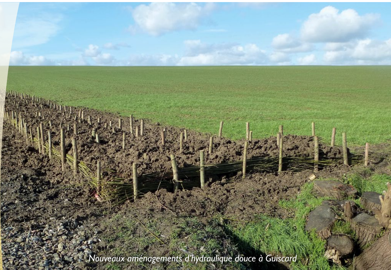
Nouveaux aménagements d'hydraulique douce à Guiscard

Avricourt Beaugies-sous-Bois Beaulieu-les-Fontaines Beaumont-en-Beine Beaurains-les-Noyon Berlancourt Bussy Campagne Candor Catigny Crisolles Ecuville Flavy-le-Meldeux Fréniches Frétoy-le-Château Genvry Golancourt Guiscard Guivry Lagny Le Plessis-Patte-d'Oie Maucourt Morlincourt Muirancourt Noyon Ognolles Pont-l'Evêque Porquericourt Quesmy Salency Sempigny Sermaize Vauchelles Villeselve