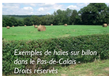
Exemples de haies sur billon dans le Pas-de-Calais